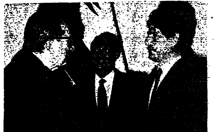
الجميل لاندريوتي: مبرمكر في غير اوانها